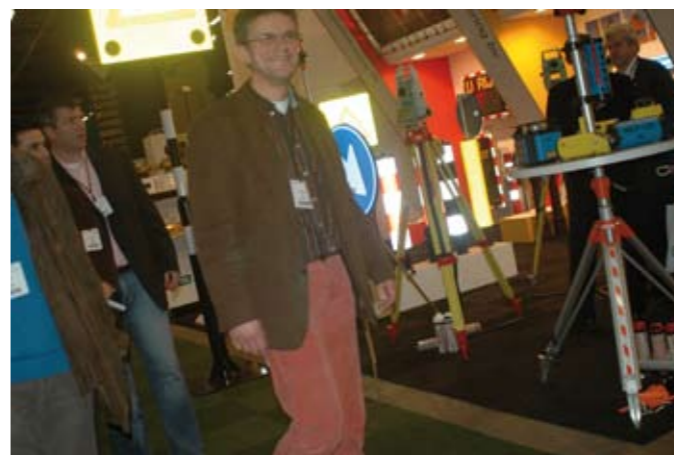
Veel bezoek op eerste beursdagen InfraTech

Tot en met gisteren registreerden zich via de website een kleine 17.000 geïnteresseerden voor een bezoek. Op de beurs zelf resulteerde dit op de eerste dag in een groei van 35% ten opzichte van 2005. Ook gisteren kwamen ruim meer bezoekers dan tijdens de voorgaande editie. Bij het ter perse gaan van dit dagbulletin (15.00 uur) stond de teller op zo'n 6200 bezoekers, waarvan ruim eenderde uit de overheidshoek. Vandaag wordt naar verwachting de topdag. We wensen u daarom wederom succes!